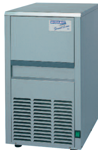
Abb. Modell S 18 L / W

Smart-Line Die preiswerten Eiswürfelbereiter für den kleinen und mittleren Bedarf.