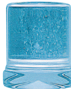
Volleiswürfel Ø 27 x 32 mm · Gewicht 18 g.

Das Eisbereitungssystem der Smart-Line produziert zylindrische Volleiswürfel im Format 27 x 32 mm. Die Eiswürfel sind glasklar und haben eine feste Konsistenz. Mit einer Leistung von 18 kg (ca. 1.000 Stück) bis 58 kg (ca. 3.200 Stück) Eiswürfeln pro Tag bietet diese Produktlinie preiswerte Lösungen für Anwender mit kleinem bis mittlerem Bedarf.